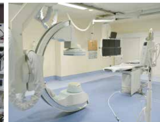
血管撮影システム