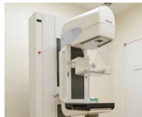
マンモグラフィ装置