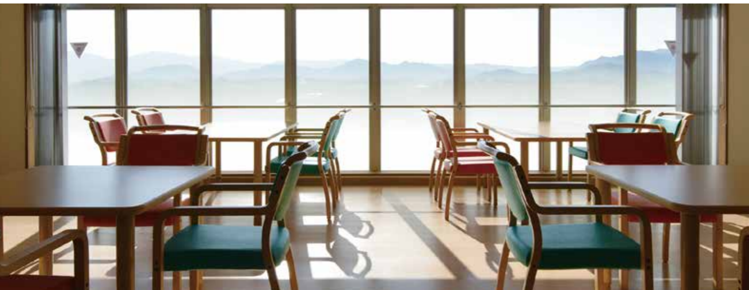
病棟食堂・談話室