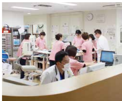
病棟スタッフステーション