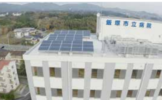
ソーラーシステム