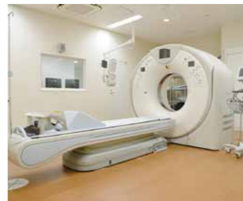
CT(80列マルチスライスCT)